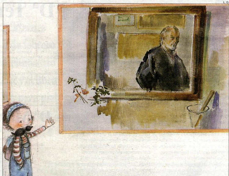
Detalle de una ilustración del libro en el que aparece un autorretrato de Gaya de 1992

Pero 'Marta y el vancejo' esconde muchas otras moralejas, como la maldad de las guerras, la necesidad de cuidar el medio ambiente o de apoyar y ayudar a la familia, gracias a la figura del abuelo de la protagonista, personaje que la adentra en el mundo del museo. Los más pequeños podrán también identificarse con esta pe-