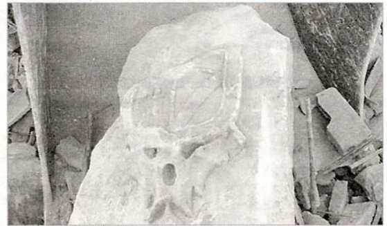
Imagen de parte del escudo de Aljucer que fue recuperado en las labores de retirada de escombros del molino