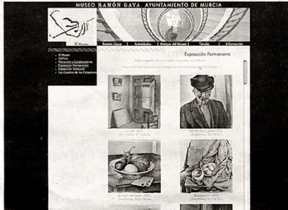
Imagen de la página de internet del museo Ramón Gaya con algunas de las obras de la exposición permanente

En concreto, en la web está disponible una biografía del genial artista, su obra pictórica y literaria, los catálogos de sus exposiciones e, incluso, una videoteca con imágenes del pintor, según fuentes municipales.