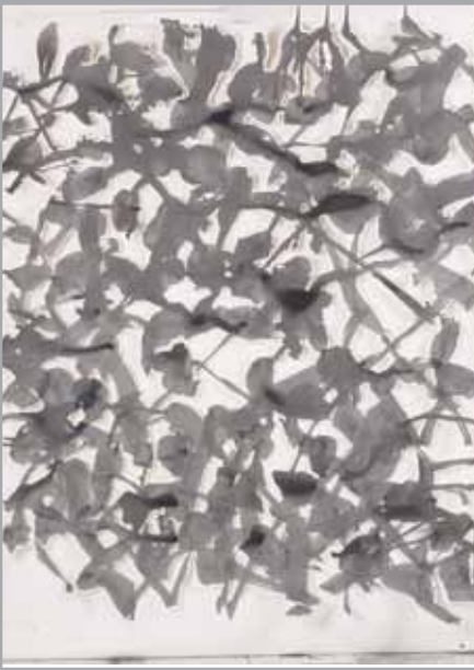
La huerta Recortable. Murcia 2009. Esmalte sintético sobre papel recortado. 180 x 140 cm