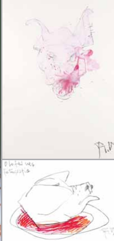
Cabeza de cerdo Boceto previo para la fotografía "Judith y Holofernes". Murcia 2009. Carboncillo y acrílico sobre papel. 112 x 76 cm