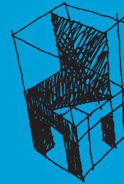
Silla en perspectiva Boceto para una escultura. Murcia 2009. Rotulador sobre papel. 29'7 x 41'5 cm