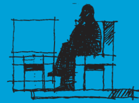
El contemplador de cuadros Boceto para una escultura. Murcia 2009. Rotulador sobre papel. 29'7 x 41'5 cm