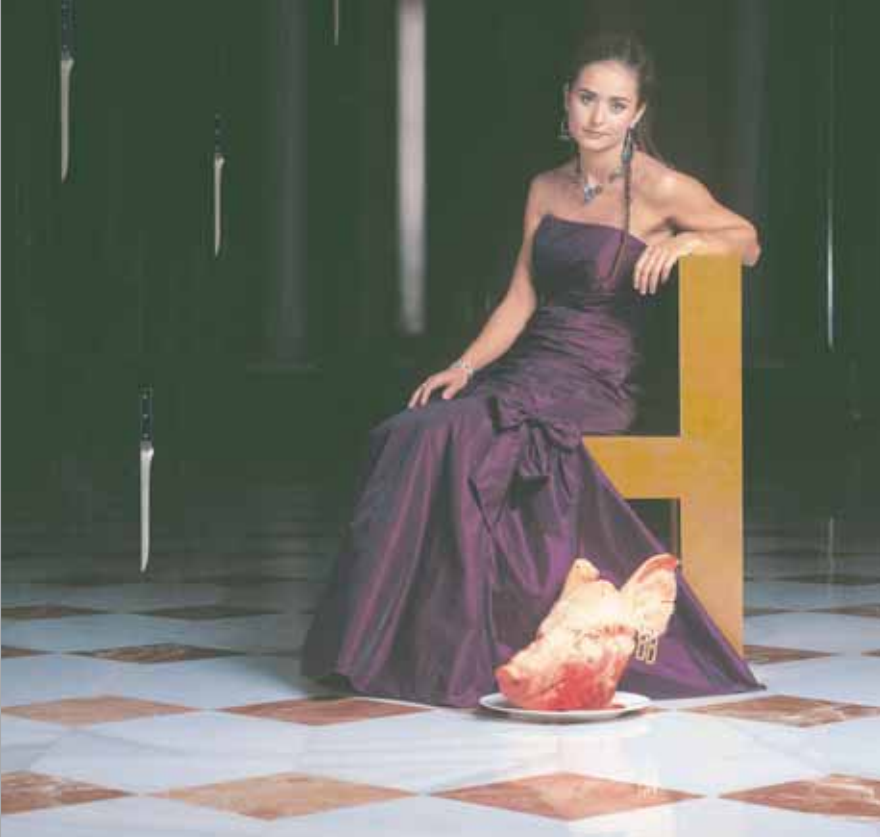
Judith y Holofernes Murcia 2009. Fotografía e impresión digital. 100 x 100 cm