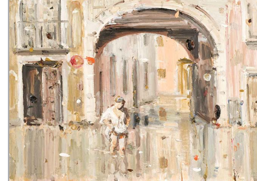
Plaza Camachos (Rembrandt y Murcia) Óleo sobre papel. 50 x 70 cm