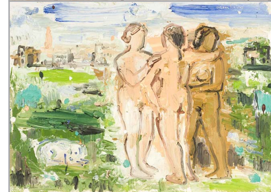
Las tres Gracias: la huerta Óleo sobre papel. 50 x 70 cm