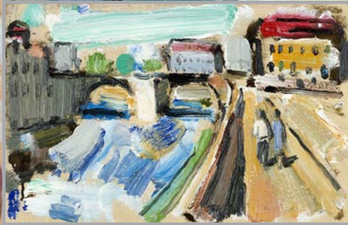
Paseo Óleo sobre cartón. 23 x 38 cm