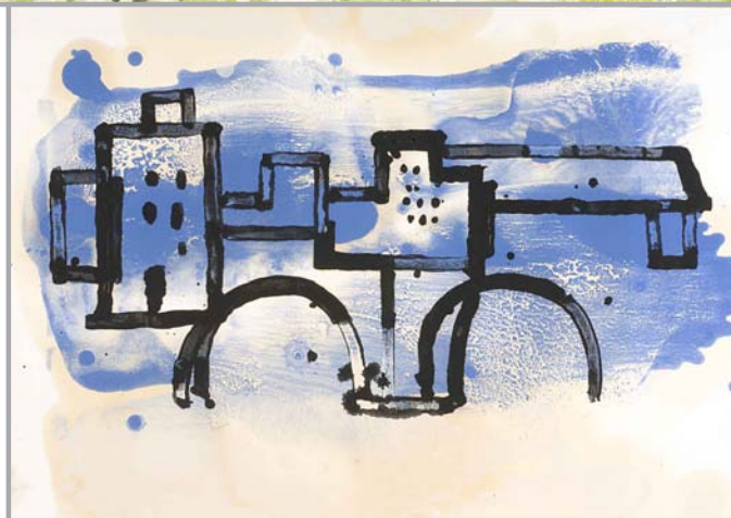
Paisaje azul Técnica mixta sobre papel. 50 x 70 cm