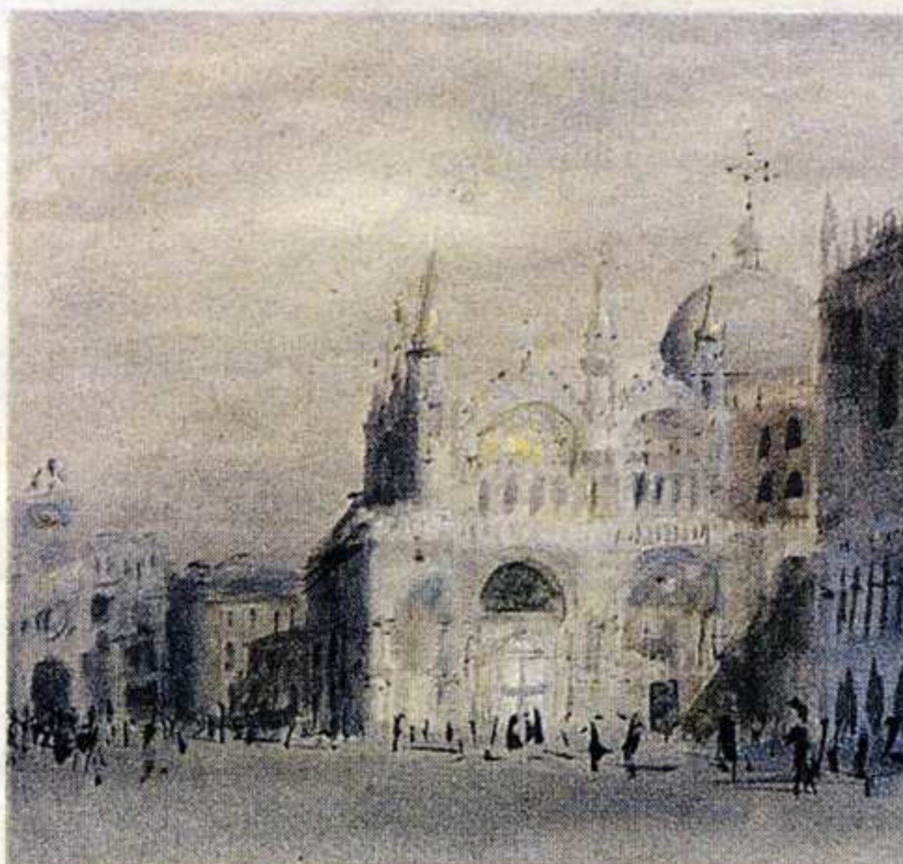
'La Piazzeta, Venecia', uno de los cuadros de la muestra.

es un resumen de las obras desde el exilio del pintor a México hasta sus últimos homenajes, en una iniciativa a la que se han sumado Cajamurcia, el Ayuntamiento de Murcia y el Museo Ramón Gaya.