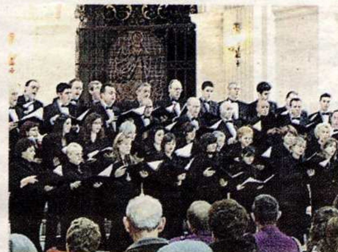
Parte del Orfeón, actuando en Yecla.