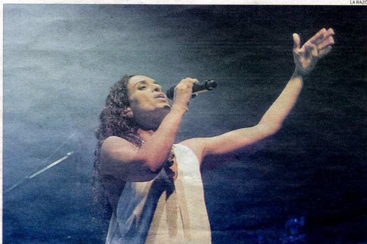
La solista israelí deleitó con su voz a cientos de seguidores durante su actuación en el Nuevo Teatro Circo de Cartagena