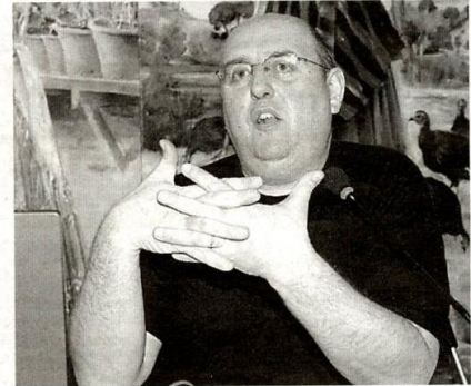
OCHO HORAS DE CONFERENCIA. El público escuchó en el Museo de Bellas Artes al crítico Castro Flórez.