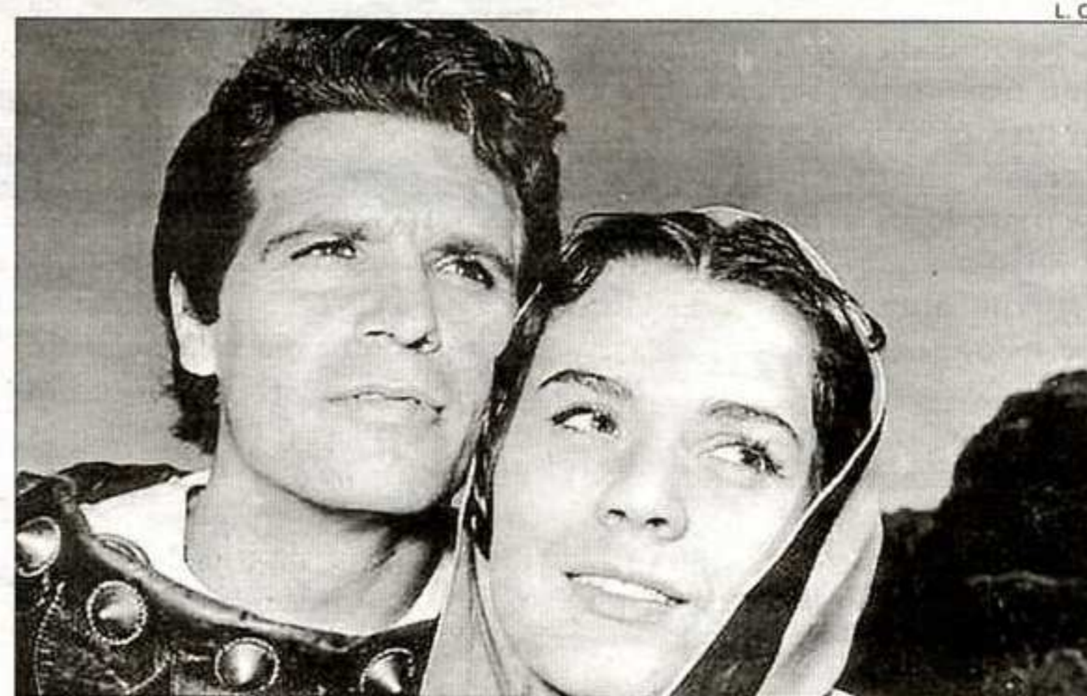
El actor, junto a Silvia Koscina, en una escena de 'Jerusalén liberada'