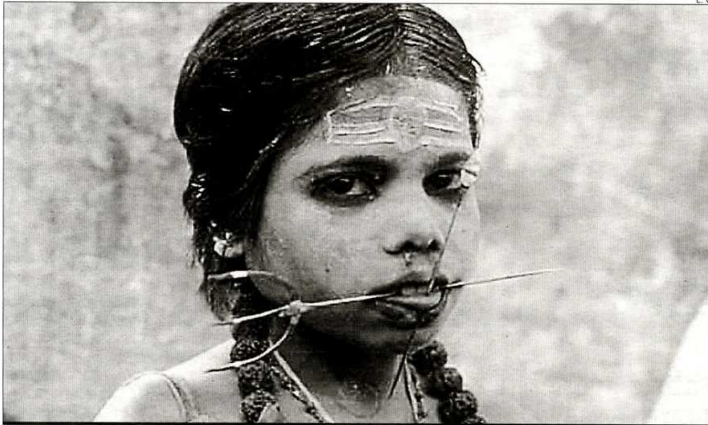
Un fotograma del documental 'Kings with Straw Mats', que se emite hoy en el Puertas de Castilla

Esta actividad se enmarca dentro del ciclo de cine Visiones sobre la India, ya que, según indicaron los programadores, Puer-