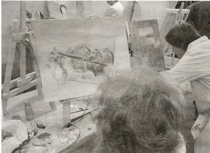
CentroCaixa de Murcia ha organizado dos talleres de 15 alumnos cada uno. ELFARO

"Ramón Gaya es el pintor murciano más importante de todos los tiempos, y uno de los más profundos e independientes del siglo XX. Contemplar