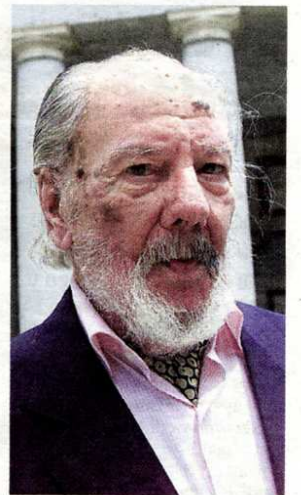
Ramón Gaya.