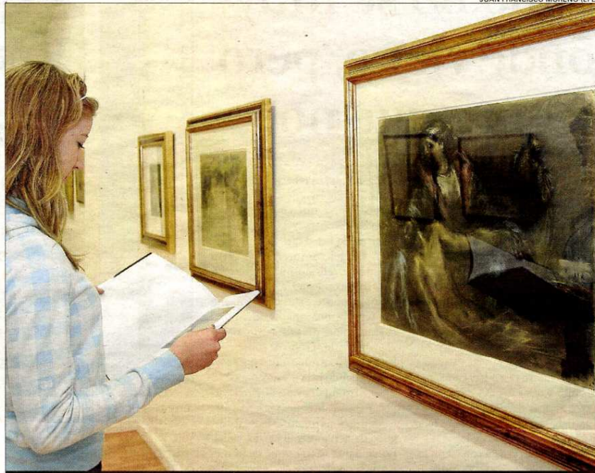
La galería Verónicas inaugura hoy 'Ramón Gaya en el exilio', con obra recuperada en México del pintor murciano