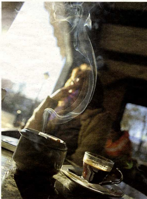
Humo de un cigarrillo en una cafetería.

Así, el VEV por persona se ha tasado en 2,91 millones de euros.