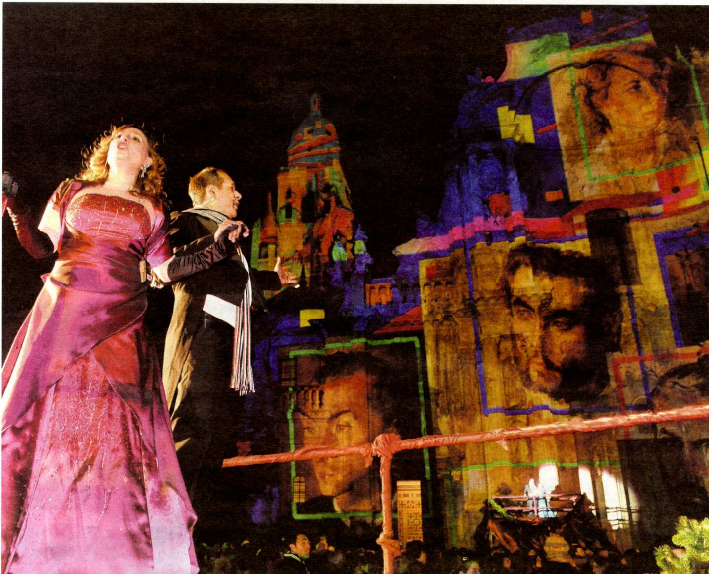
Miembros del Café de la Ópera pusieron voz al espectáculo de luz que anoche se inauguró en la plaza de Belluga.