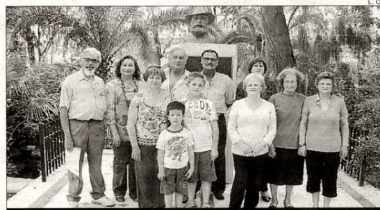
Los integrantes de Parnaso posan junto al busto del poeta Vicente Medina

fue representada en Archena durante las pasadas fiestas del Corpus, y el éxito de público obligó a los integrantes de la agrupación teatral a repetir la representación la siguiente noche. Con esta representación, los archeneros siguen recordando a uno de sus vecinos más ilustres, conocido especialmente por su obra 'Aires murcianos' y que desde 1994 cuenta con una fundación que lleva su nombre.