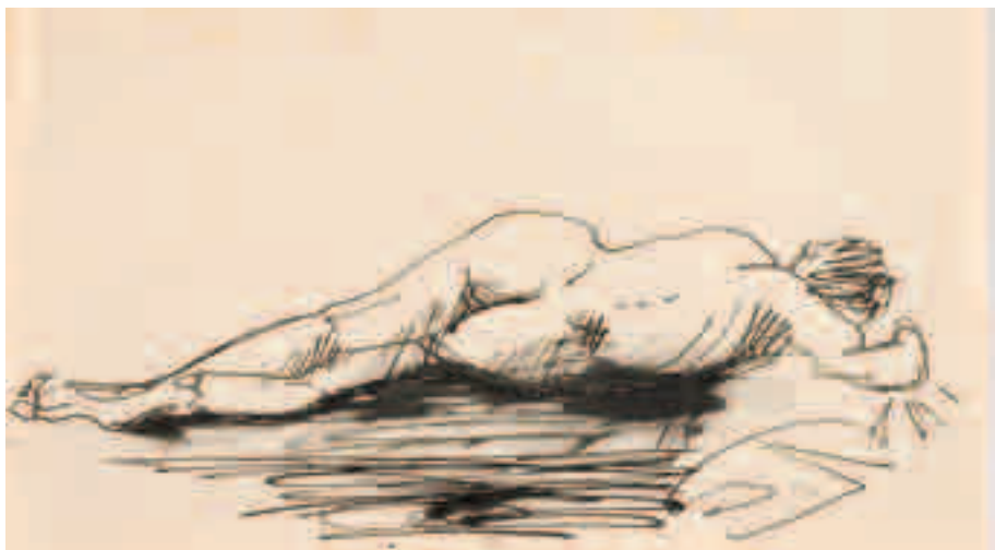
Sin título Bolígrafo sobre papel 12'5 x 17'5 cm