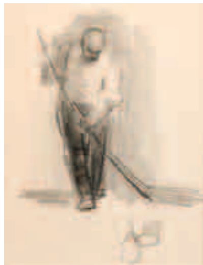
Barrendero Lápiz sobre papel 14'5 x 11 cm