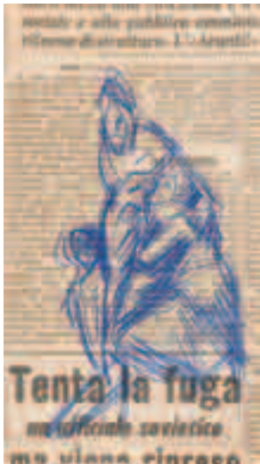
Apunte Bolígrafo sobre papel 16 x 9'5 cm