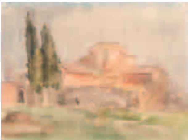
Iglesia Acuarela sobre papel 24 x 31,8 cm