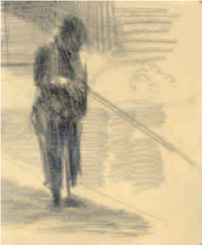
Figura masculina Lápiz sobre papel 10 x 8 cm