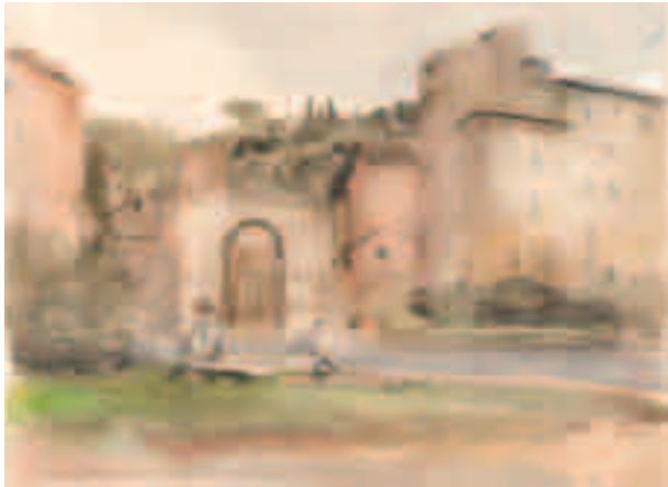
Roma Acuarela sobre papel 23,4 x 31 cm