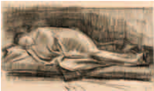
Durmiendo Lápiz sobre papel 8'5 x 11 cm