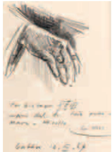
Mano III Lápiz sobre papel 21 x 14'5 cm