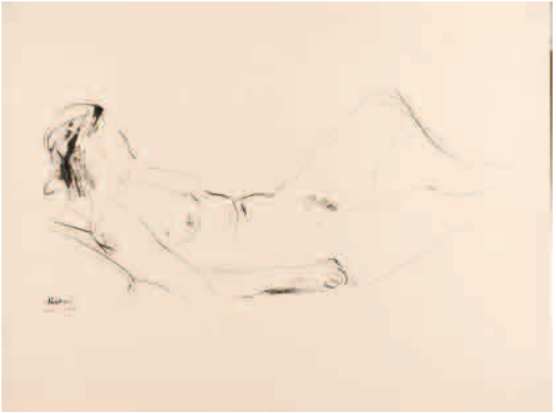
Mujer. 1958 Tinta sobre papel 36 x 47'5 cm