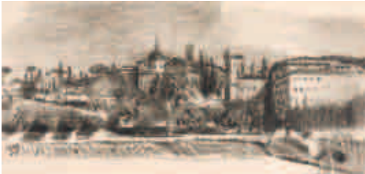
Paisaje Carbón sobre papel 14,2 x 30 cm