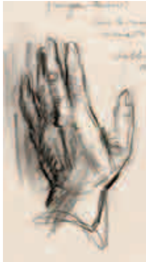
Mano II Lápiz sobre papel 21 x 11'5 cm