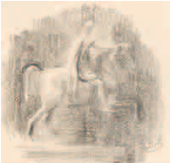
Hombre a caballo Lápiz sobre papel 10'5 x 11 cm