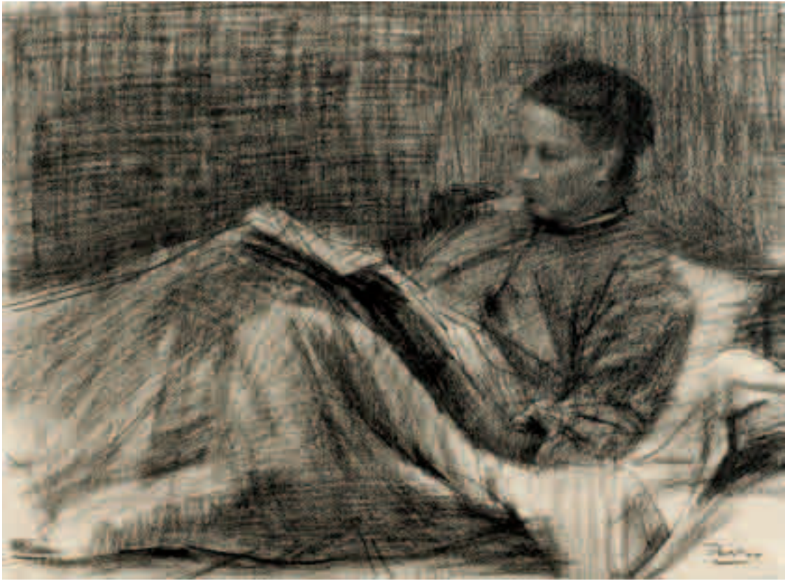
Mujer leyendo Carbón sobre papel 27,5 x 37 cm