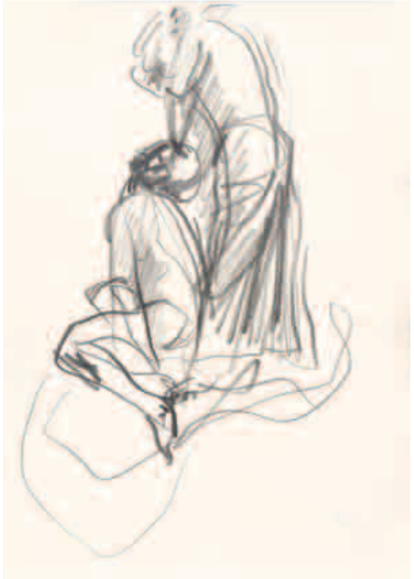
Boceto Lápiz sobre papel 21 x 14'5 cm