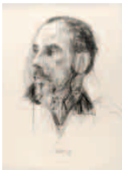
Ramón Gaya. 1958 Carboncillo sobre papel 47,5 x 34 cm