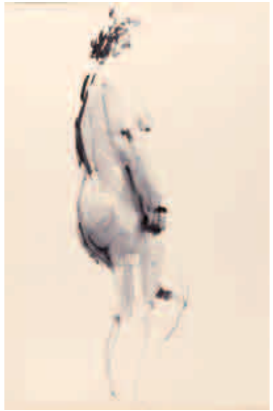
Desnudo Tinta sobre papel 50 x 33 cm