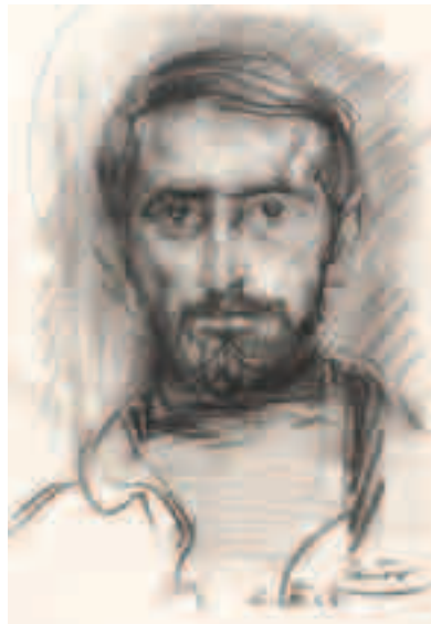
Autorretrato Carbón sobre papel 45,5 x 31,5 cm