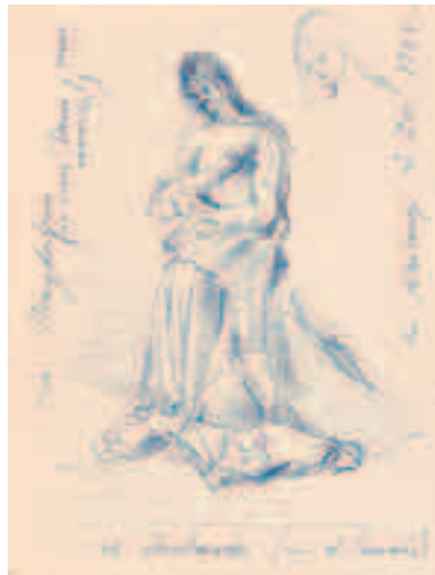
Mujer Bolígrafo sobre papel 13'5 x 10'5 cm