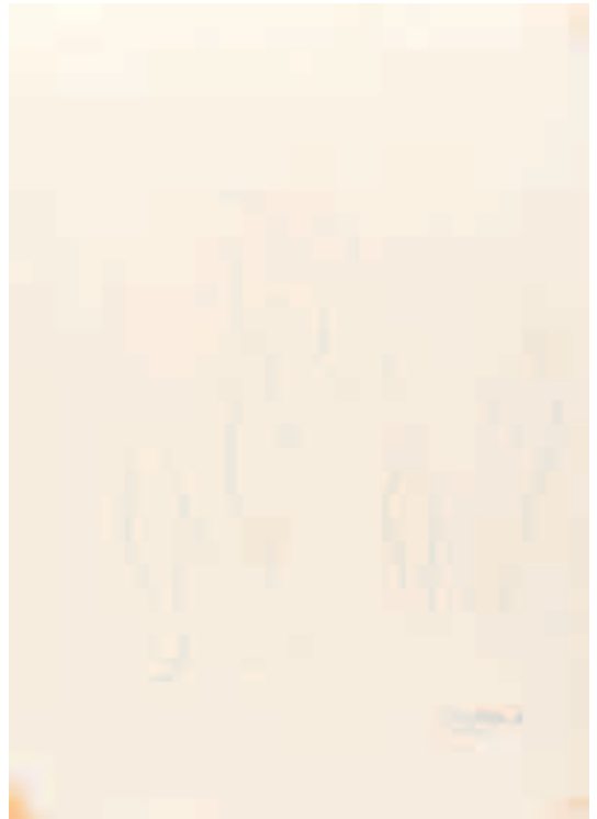
Desnudos. 1963 Lápiz sobre papel 40 x 30 cm