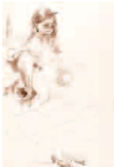
Bailaora Tinta sobre papel 33,5 x 23,5 cm