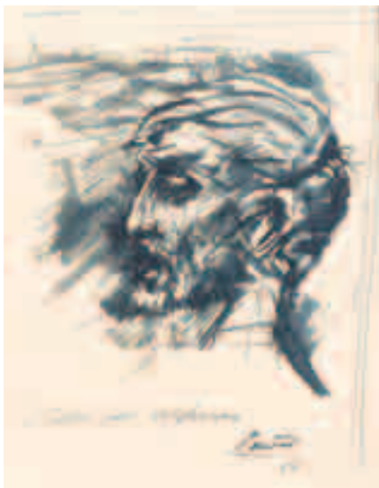
Estudio para Holofernes. 1964 Tinta sobre papel 22 x 18 cm