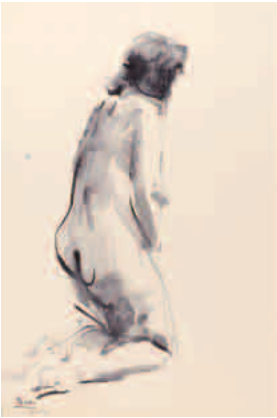
Desnudo. 1960 Tinta sobre papel 50 x 33 cm