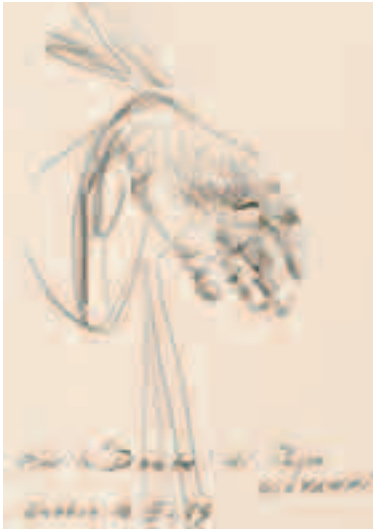
Mano I Lápiz sobre papel 21 x 14'5 cm