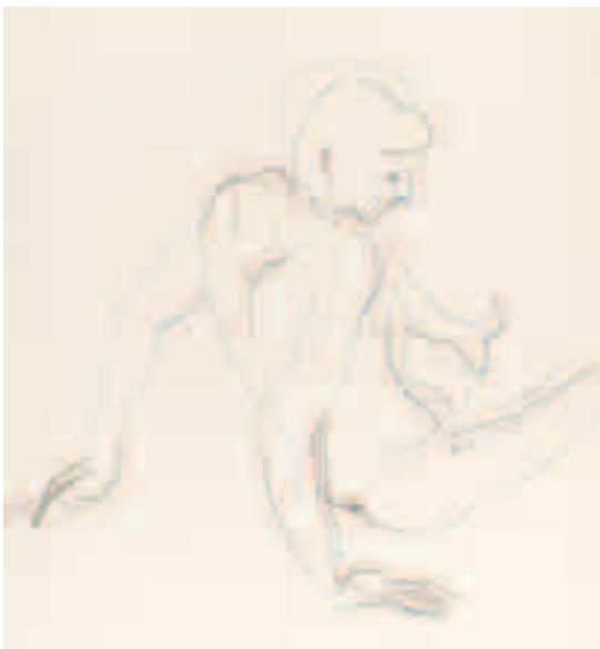
Desnudo. 1963 Lápiz sobre papel 40 x 30 cm