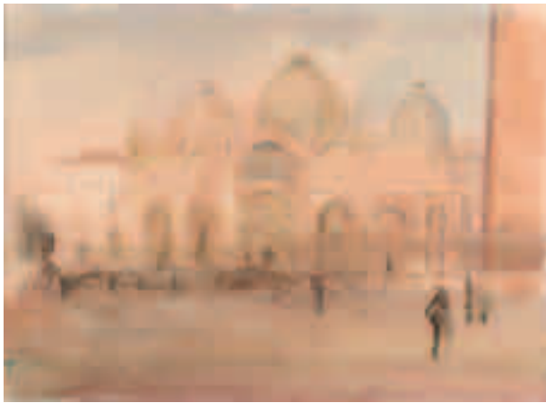
Plaza de San Marcos Acuarela sobre papel 34,5 x 48 cm