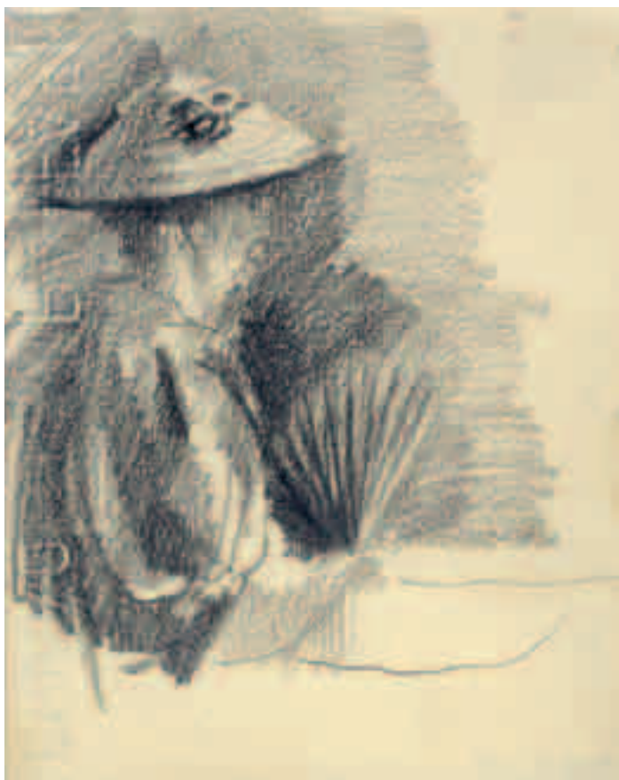
Figura china lápiz sobre papel 14 x 11 cm