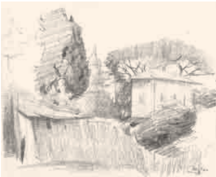
Paisaje Lápiz sobre papel 9 x 11'5 cm