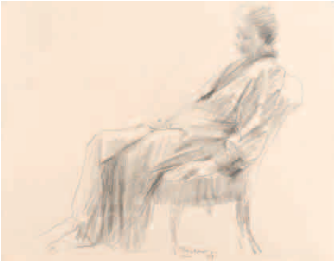
Mujer del sillón Carbón sobre papel 30 x 38 cm