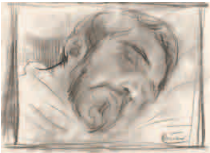
Hombre durmiendo Lápiz sobre papel 31'5 x 45 cm