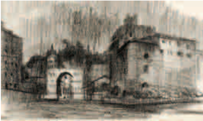
Arcos Carbón sobre papel 33 x 24,8 cm