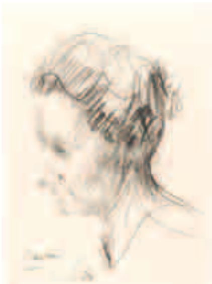
Cabeza Carbón sobre papel 31,6 x 23,4 cm